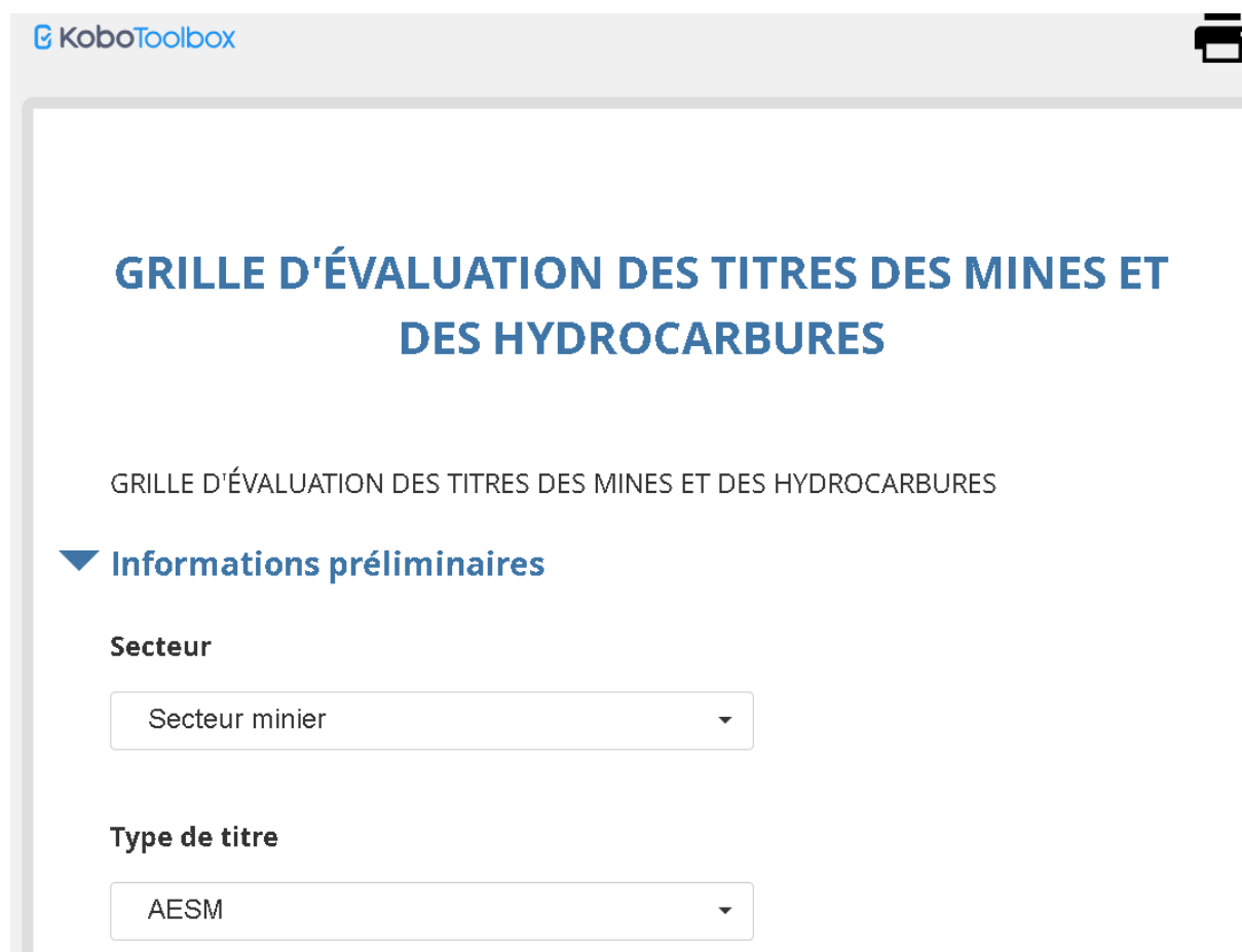
Tableau 4 : Aperçu de la grille de contrôle de conformité implémentée sur Kobotoolbox

Cette grille de contrôle implémentée sur la plateforme Kobotoolbox, nous a permis de collecter une quantité importante de données tout en facilitant l'analyse 8 . Pour alimenter la plateforme, des séances de travail ont eu lieu avec la direction du cadastre minier et la direction générale des hydrocarbures. C'est à l'occasion de ces séances que les dossiers numérisés relatifs aux procédures d'octroi, de renouvellement et de transfert des titres miniers et pétroliers ont été communiqués à l'équipe de recherche.