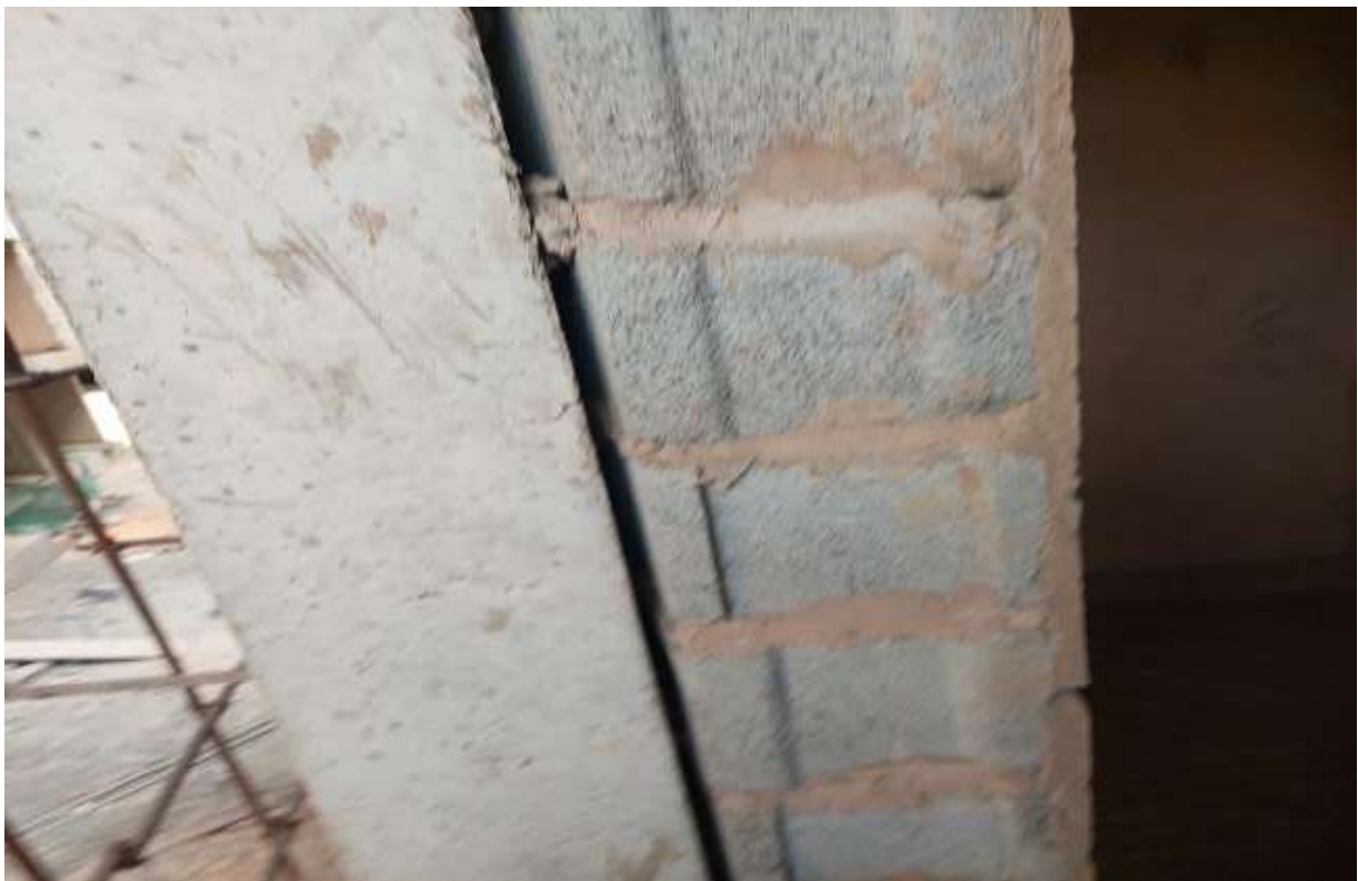
Image 6 : Absence de polystyrène au niveau des joints de dilatation

Recommandation N°5 : Nous recommandons à la SICAP de veiller à l'installation de polystyrène pour améliorer l'isolation thermique et acoustique de même que la durabilité de la structure.