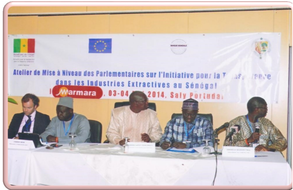
Vue du Présidium lors de la cérémonie d'ouverture de l'atelier